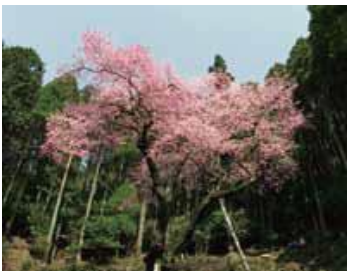
とらお ぎくら 虎尾桜 《町指定天然記念物》