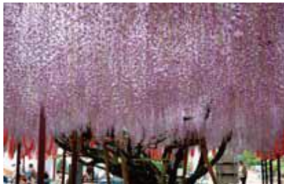
じょうぜんじ ふじ 定禅寺の藤 《県指定天然記念物》

定禅寺の藤(迎接(こうじょう)の藤 県指定)に代表されます。ゴールデンウィーク頃に藤色の花を咲かせます。